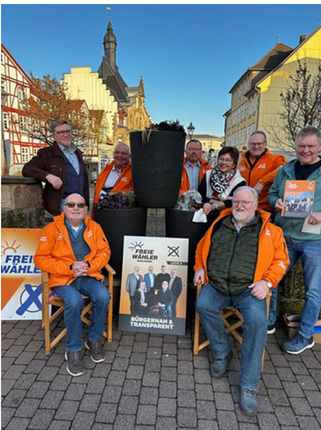
Das Team auf dem Wahlstand in Großalmerode am sonnigen Freitagnachmittag: Gute Gespräche auch mit einigen anwesenden WG-Mitgliedern.